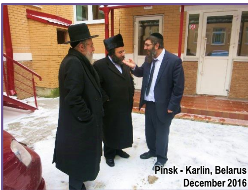
Pinsk - Karlin, Belarus December 2016

הרבני החסיד ר' מרדכי גאלד שליט"א אינאיינעם מיט די עסקני אבותינו ביים שטח הביה"ח