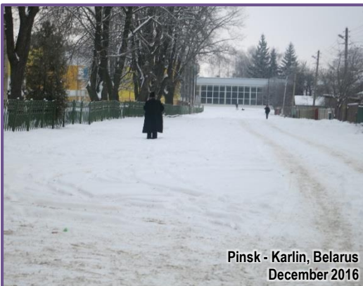
Pinsk - Karlin, Belarus December 2016

הרבני החסיד ר' מרדכי גאלד שליט"א אינאיינעם מיט די עסקני אבותינו ביים שטח הביה"ח